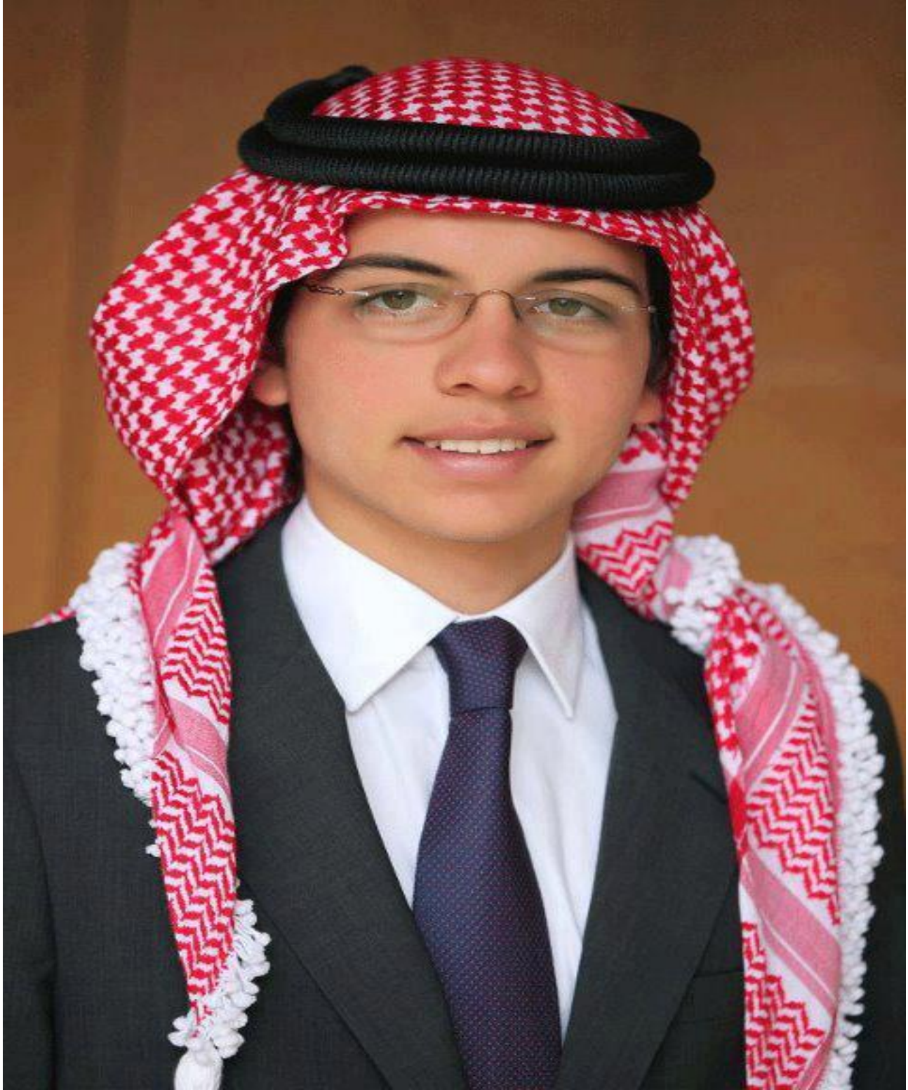
صاحب السمو الملكي الأمير الحسين بن عبدالله الثاني ولي العهد