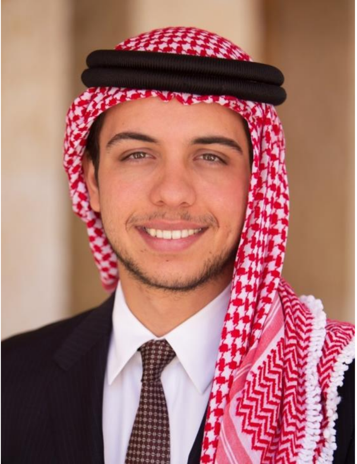
صاحب السمو الملكي الأمير حسين بن عبدالله الثاني ولي العهد المعظم