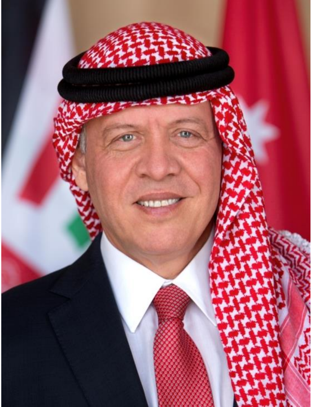
حضرة صاحب الجلالة الهاشمية الملك عبدالله الثاني ابن الحسين المعظم حفظه الله